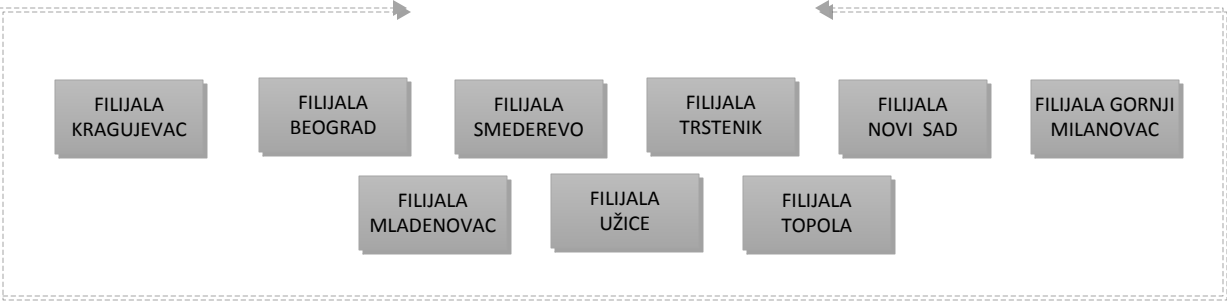
MREŽA FILIJALA BANKE